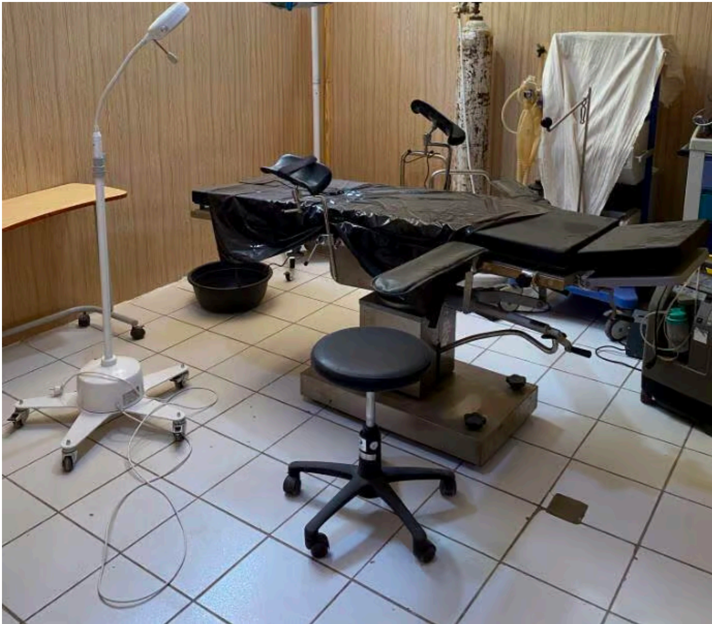
ציוד דל, ללא מיזוג, עם זבובים. חדר הניתוח המיושן במרפאה בצ'אד

"שם הכול קורה במכפלות, בעוצמה מטורפת, מכל הבחינות: גיל הנשים, והחריפות של הנזקים הגופניים, והמצב החברתי והדתי וגם בגלל מעמד האישה שם, שמאפשר את המצב הזה. הנשים האלה, הרבה מהן עוברות מילת נשים. הטלת מום באברי המין. זה מנהג שמקורו חברתי-דתי. הוא מאוד בעייתי ומעלה את הסיכון לקרעים גינקולוגיים"