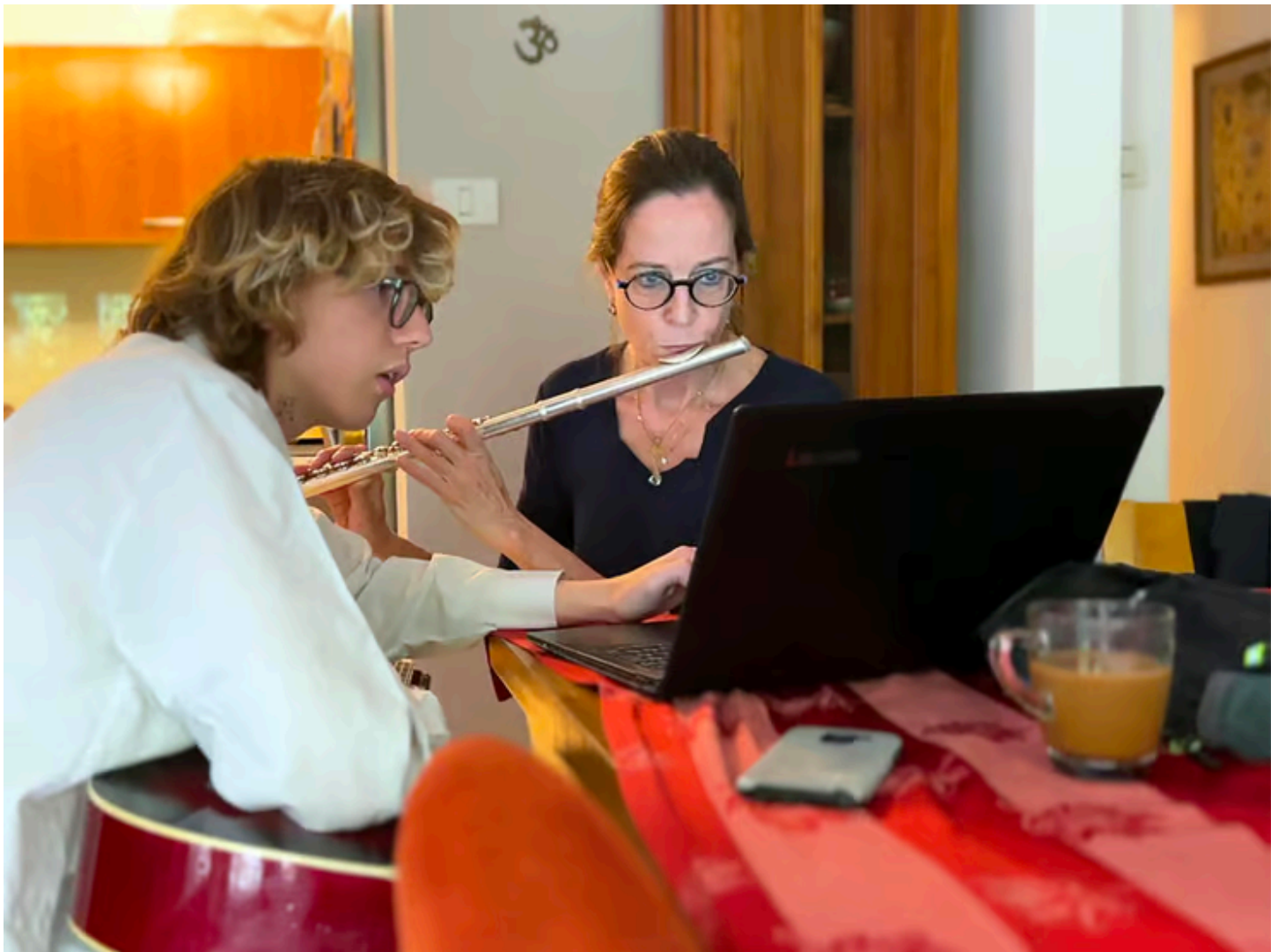
צד הקריירה הרפואית. ארבל עם בנה, בביתם

"כך נוצר החיבור החזק שלי ל-IFA. הם עושים משהו שמאוד מתאים להשקפת העולם שלי – לתת את מה שיש לך, מקצועית, לכל אדם ובכל מקום, וללא ביקורת. אתה לא זורק חבילה והולך, ואתה באמת מנסה לתקשר עם הנשים שם ומשאיר משהו אחריו. טיפלתי שם בילדה בת 15, שילדה שנתיים קודם לכן. היא הייתה כל כך ילדה, מתוקה וחביבה – תקשרנו רק בעיניים. בחיכים. אני לא אשכח את העיניים שלה."