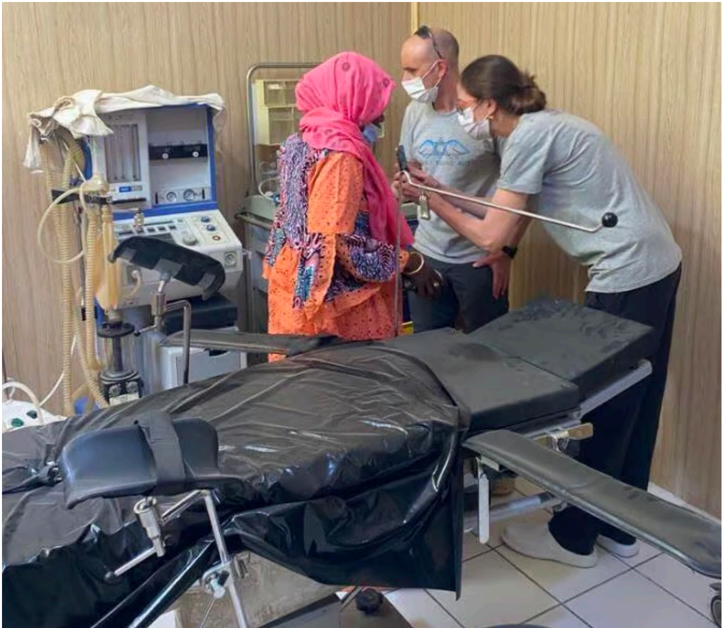
ארבל עם מתנדב מהצוות הרפואי של IFA ופציינטית מקומית, בוחנים בדיקות לפני ניתוח